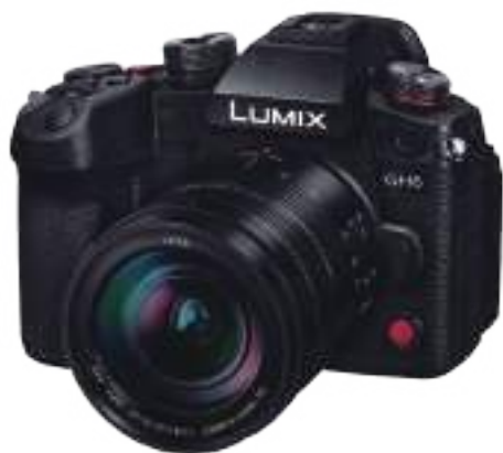
LUMIX GH6 一眼カメラ