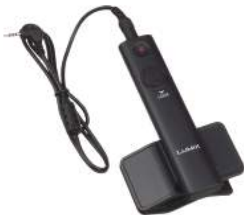
シャッターリモコン