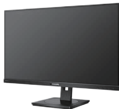
映り確認用モニター