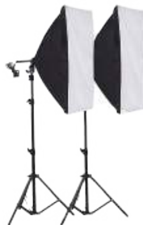
照明（ソフトボックス）