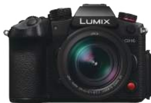
LUMIX GH6 カメラ